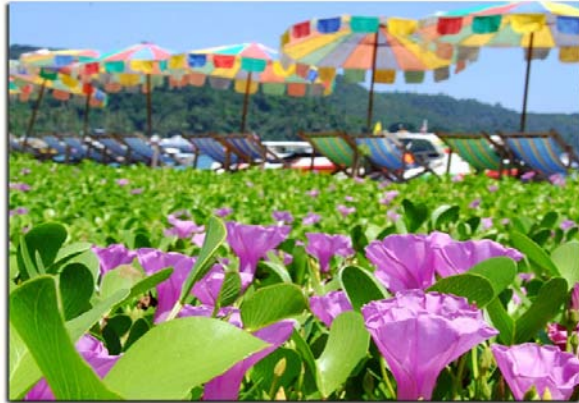
ผักบุ้งทะเลพบเห็นตามหาดทรายชายทะเลทั่วไป

โปะลงบนบาดแผลก็ได้เช่นกัน แล้วจึงล้าง แผลด้วยน้ำทะเลอีกครั้งทิ้งไว้แห้ง ถ้ามีจี๊ผึ้งก็ ให้ทาทุก 2-3 ชั่วโมง หลังจากทำการปฐม พยาบาลเสร็จแล้ว ก็ควรนำผู้เคราะห์ร้ายไป หาแพทย์เพื่อทำการรักษาต่อไป